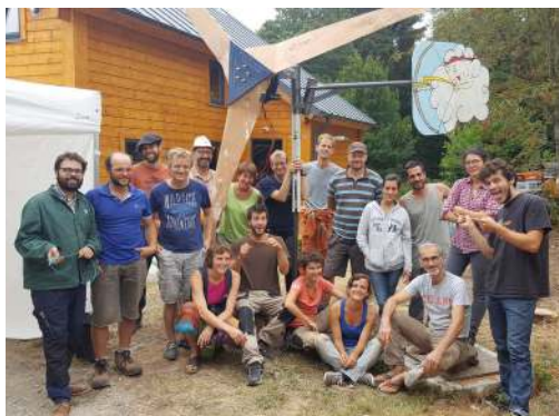
Fabrication et installation d'éolienne

Quelques exemples d'actions menées par l'association :