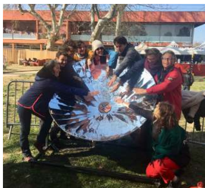
Cuiseur solaire parabolique