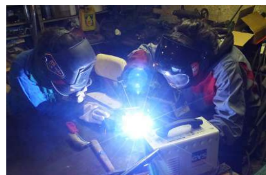
Initiation à la soudure à l'arc