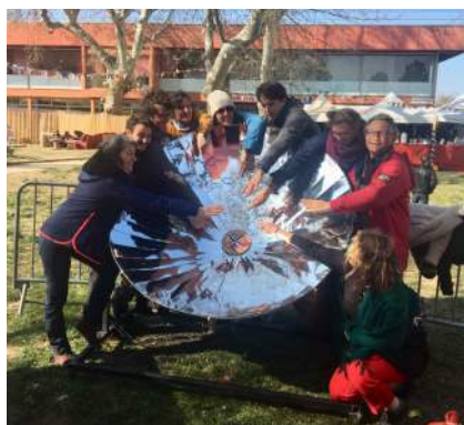
Cuiseur solaire parabolique