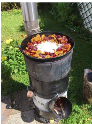
Cuiseur destiné à la cuisine générale pour 5-15 pers avec un wok de 36cm de diamètre