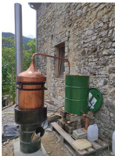
Cuiseur adapté à une cuve cylindrique de 100l en cuivre – débit vapeur jusqu'à 7L/h