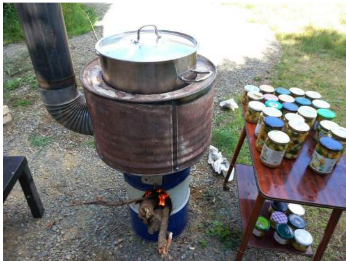
Cuiseur destiné à la stérilisation de bocaux Gamelle inox 35L