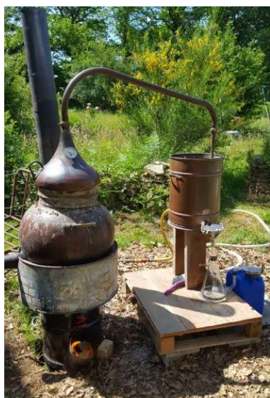
Cuiseur adapté à un alambic – Cuve de 50L portugaise en cuivre – débit vapeur jusqu'à 10L/h